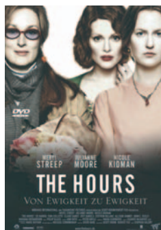
DVD-Boom dank Toptitel

mit dem Verkauf und der Vermietung von DVD und VHS-Bildträgern in 2002 der Rekordumsatz von insgesamt 1,4 Mrd. Euro erwirtschaftet werden. Das entspricht einer Gesamtmarktsteigerung von 22,1% gegenüber dem Vorjahr.